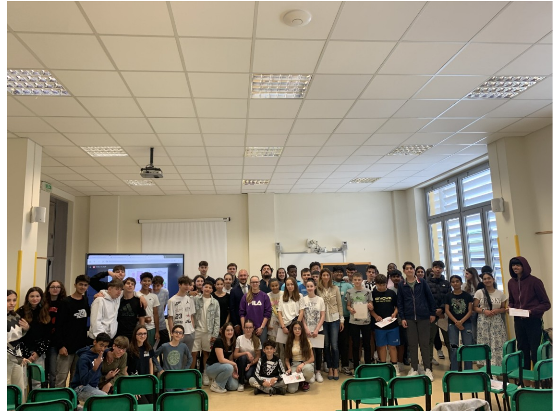
PREMIAZIONE CLASSI 3 A E 3 B I.C. SACCHI DI PIADENA

Questa edizione del bando di concorso prevedeva la realizzazione di un progetto di riqualificazione di un'area dismessa o abbandonata con trasformazione in spazi a destinazione sportiva. Si richiedeva agli studenti di individuare l'area nel proprio territorio e di progettare un intervento che prevedesse la realizzazione di un'infrastruttura e dell'area circostante ad uso sportivo, per attività ludico-motoria/ amatoriale.