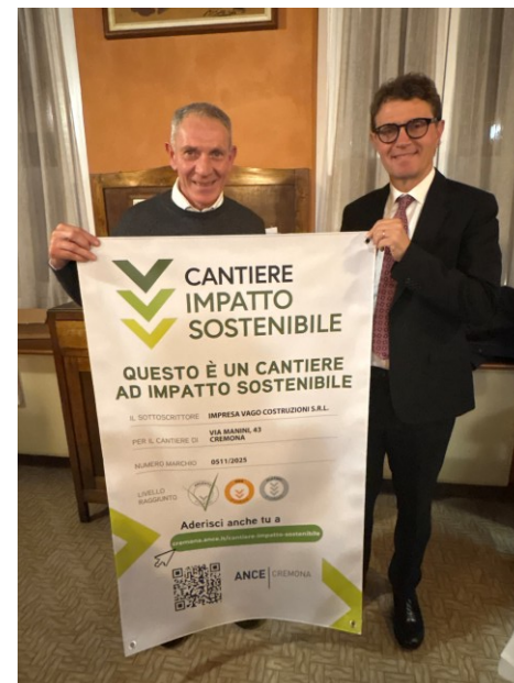
Vago Costruzioni srl