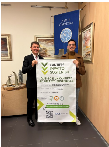
F.lli Ceriali snc