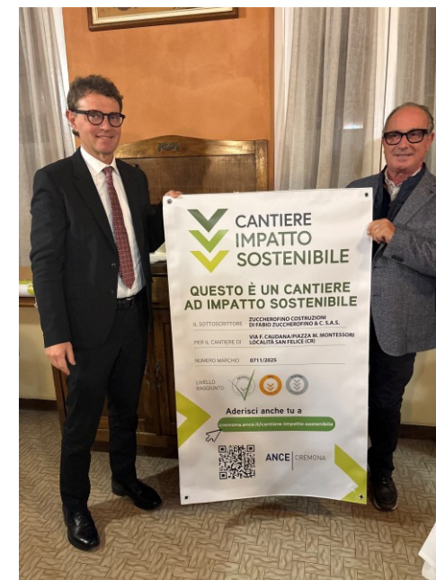
Zuccherofino Costruzioni sas